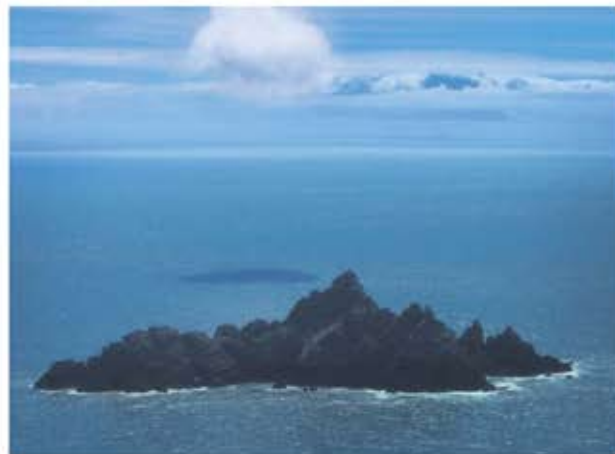
Langt ude i Atlanterhavet ligger de to klippespids, Skellig Islands.