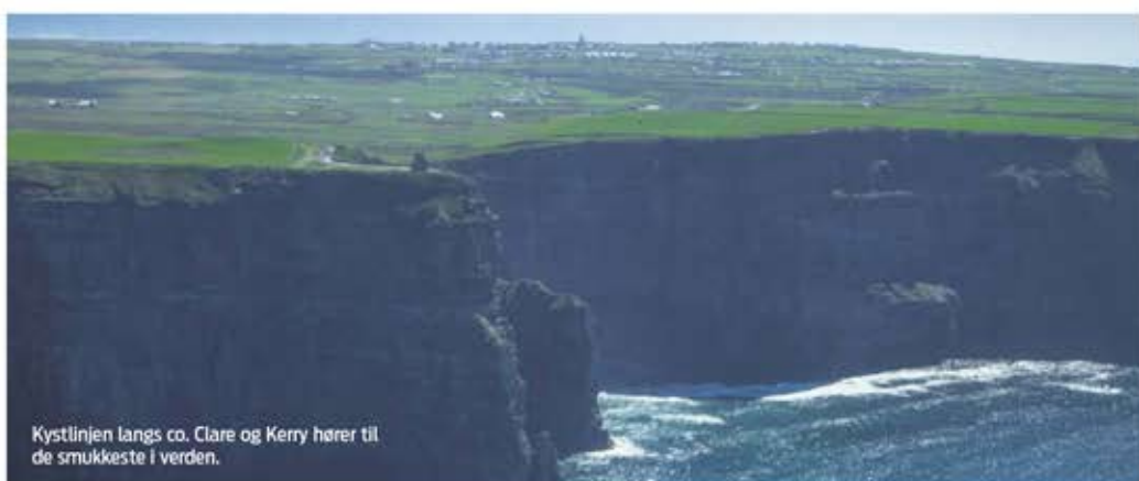
Kystlinjen langs co. Clare og Kerry hører til de smukkeste i verden.

perfekt ned og fortsætter heldigvis ikke ud over den to meter lodrette klippekant ned i Atlanterhavet. Lufthavnspersonalet nyder den varme sol uden for den lille bygning, og vi bliver varmt modtaget og tilbudt kørsel til den største by på øen, Kilroman.