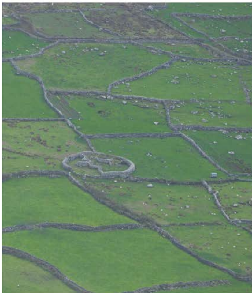
Mennesket har formet naturen, og naturen har formet mennesket. 7.800 km stendiger og ældgamle runde forter præger landskabet på den største af Aran-øerne, Inishmór.