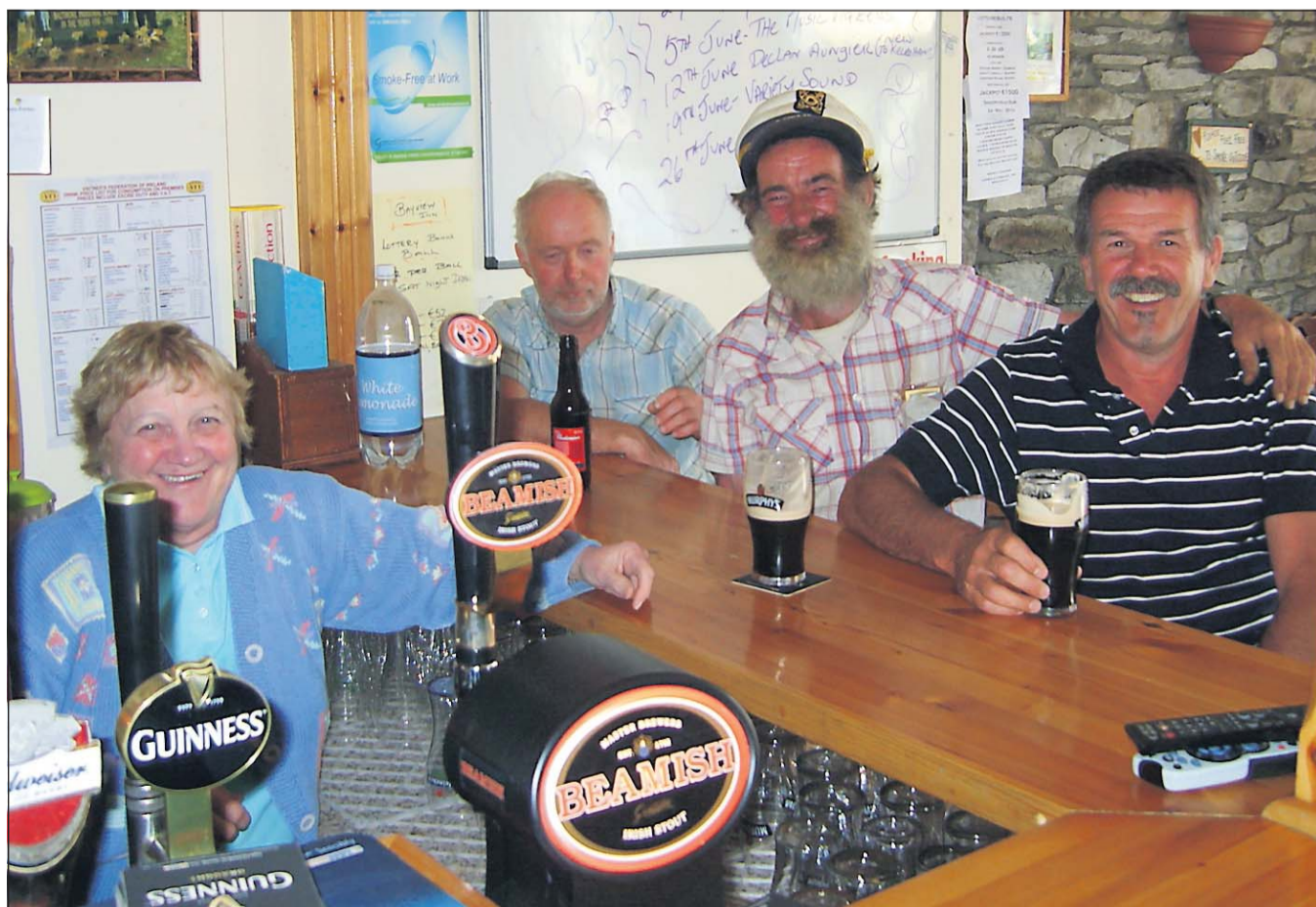
Belønningen efter en lang vandretur er en kølig Guinness på den lokale pub.

Ved den nedlagte kobbermine bliver stien til en smal afsats højt over Atlanterhavets frådende indigoblå bølger 50 me-